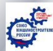
Тверское региональное отделение «СоюзМаш России»

Председатель Оргкомитета, д.э.н., профессор, зав.кафедрой экономической теории Института экономики и управления 01 марта 2022 г.